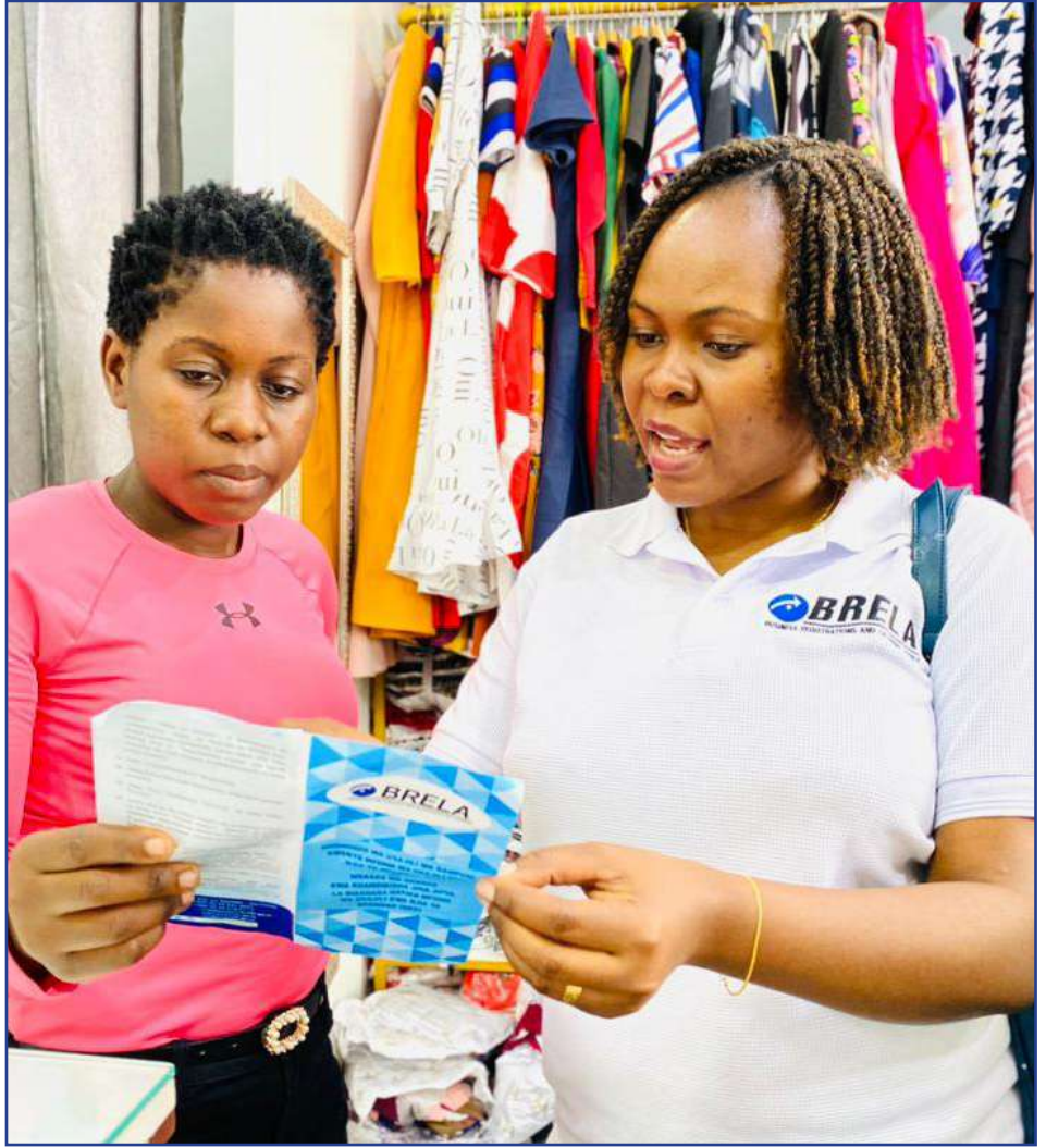
Maafisa wa Wakala wa BRELA wakipita mtaa kwa mtaa katika maeneo mbalimbali ya wilaya za mkoa wa Dar es Salaam wakati wa zoezi la ukaguzi elimishi juu umuhimu wa kurasmisha biashara.

Ukaguzi huu elimishi uliofanyika katika wilaya zote za Jiji la Dar es Salaam ambazo ni Ilala, Kinondoni, Temeke, Ubungo na Kigamboni.