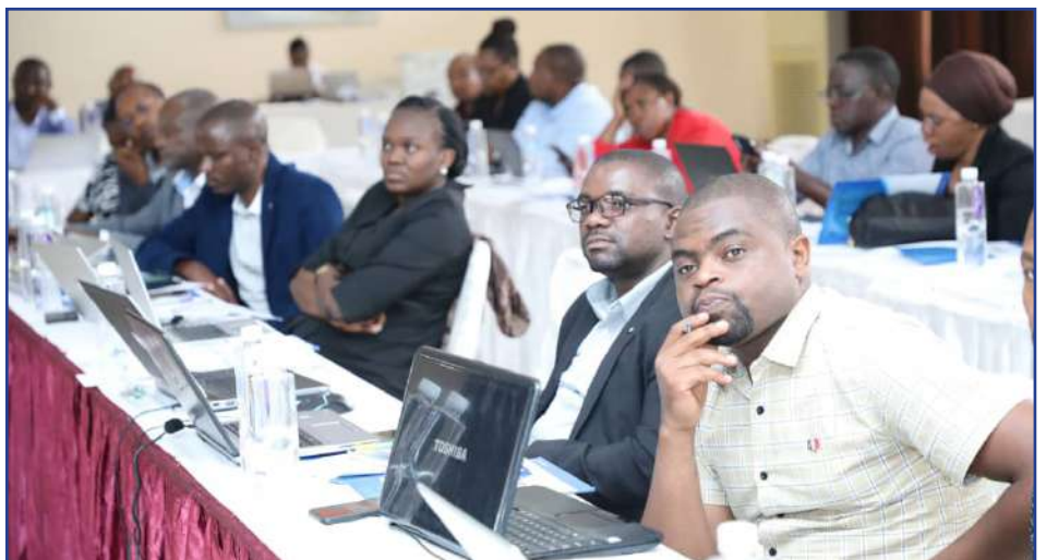
Baadhi ya washiriki wa kikao kazi cha Taasisi za Udhibiti wakimsikiliza Afisa Mtendaji Mkuu wa BRELA akitoa neno la ukaribisho wakati wa kikao hicho.

BRELA, ilianzishwa chini ya Sheria ya Wakala za Serikali Na. 30 ya mwaka 1997 na kuzinduliwa rasmi tarehe 3 Desemba, 1999 ikiwa chini ya Wizara ya Viwanda na Biashara. Majukumu ya BRELA ni pamoja na Kusajili majina ya Biashara, Kampuni, Alama za Biashara na Huduma, Utoaji wa Hataza, Utoaji wa Leseni za Biashara Kundi “A” na Utoaji wa Leseni za Viwanda na Vyeti vya Usajili wa Viwanda.