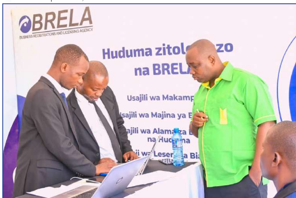
Mmoja wa wananchi waliofika katika banda la BRELA kusajili jina la biashara wakati wa maonesho ya 18 ya Afrika Mashariki yaliyofanyika katika viwanja vya Furahisha jijini Mwanza.