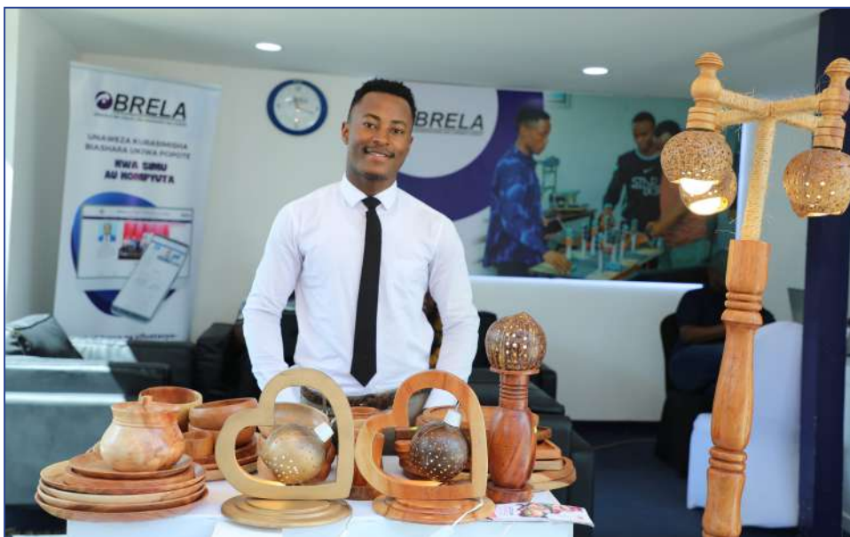
Mmoja wa wabunifu akionesha baadhi ya bidhaa zake wakati wa Maonesho ya 47 ya Kimataifa ya Biashara Dar es Salaam

Dhana ya Miliki Ubunifu japokuwa katika mazingira ya Kiafrika bado inaonekana kuwa ngeni; lakini uhalisia wake ni kwamba Miliki Ubunifu zimekuwepo tangu dahari. Binadamu amekuwa akibuni na kuvumbua vitu na dhana mbalimbali tangu kale. Maendeleo ya jamii katika siasa, uchumi na teknolojia imekuwa ni chachu ya kuibadilisha dhana ya Miliki Ubunifu kuja kuwa kama ambavyo inaeleweka na kufahamika leo hata kuundiwa