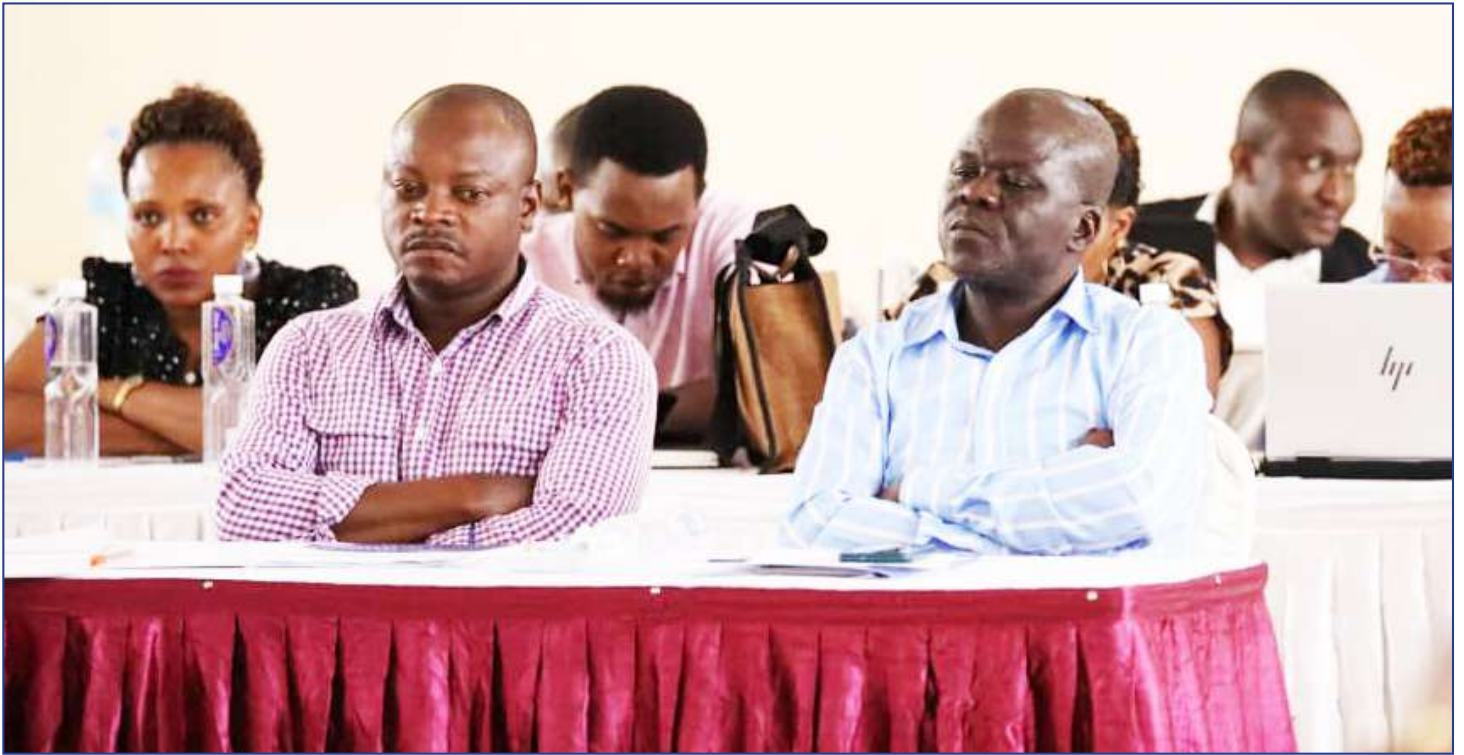
Baadhi ya washiriki wa kikao kazi cha Taasisi za Udhibiti wakimsikiliza Katibu Mkuu wa Wizara ya Viwanda na Biashara akifunga kikao hicho.